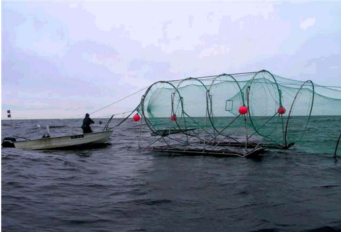
Push-up rysiä koetaan Suomenlahdella