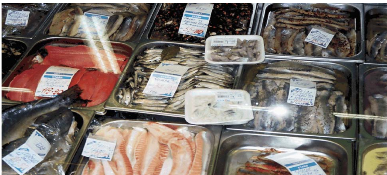
Pietarilaisen marketin irtomyynnissä olevaa suolakalavalikoimaa

Irtomyynnissä olleiden tuotteiden kilohintoja ruplissa, hinta on suluissa euroina. Särkivobla 169,00 ruplaa/kg (4,70), ahven 160,00(4,46), hauki 120,00 (3,35) lahna 78,00 (2,10) Suolattua kilohailia ja silakkaa myytiin palvelutiskeistä irtomyynnistä 32,90 ruplaa/kg (0,90) sekä monin eri tavoin pakattuna mm lasipurkkeihin ja vakuumiin 70 ruplaa/kg (2,00). Pienemmissä myyntipisteissä myyjät valittivat suolattun kilohailin saatavuuden olevan heikkoa. Kunnollisen kokoista tavaraa ei tahtonut saada mistään, mikäli ylipäättään jotain sai myyntiin.