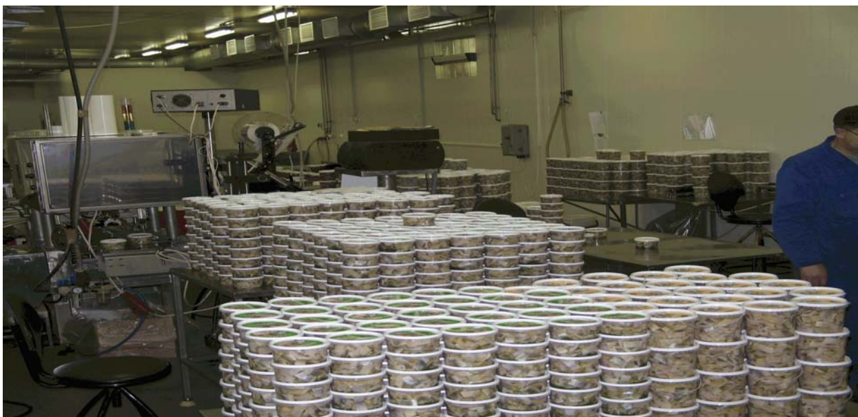
Pietarilaisen jalostuslaitoksen pakkaamia tuotteita

Selvitysmatkan tavoite saavutettiin ja jopa ylitettiin. Nyt käytettävänä on reseptejä joiden avulla voidaan valmistaa koe-eriä, laskea tuotekalkyyleja sekä selvittää vienti ja tuontimuodollisuuksia. Suolatun kilohailin osalta näytti olevan selkeitä mahdollisuuksia viennin aloittamiseen heti kun sopivaa raaka-ainetta olisi saatavilla loka- marraskuussa.