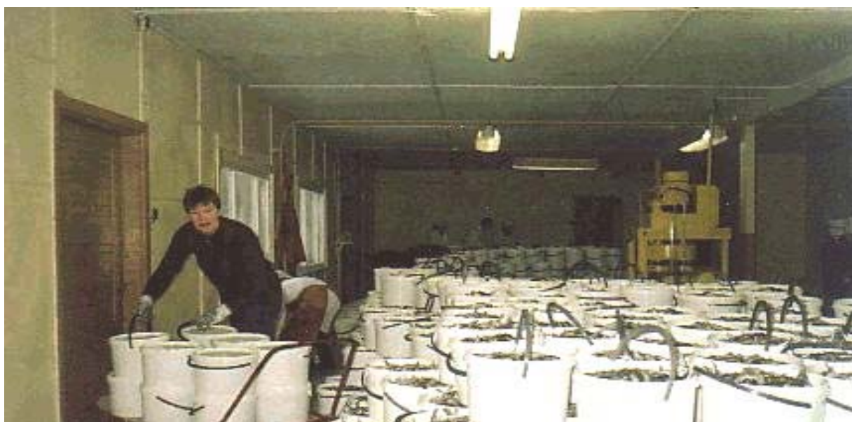
kalan suolausta Virossa

Suolattua ja maustettua kilohailia myydään vähittäiskaupoissa sekä irtomyynissä että pakattuna. Yleisin pakkaus on muovipurkki. Päälysymerkinnät ja etiketit ovat korkeatasoisia.