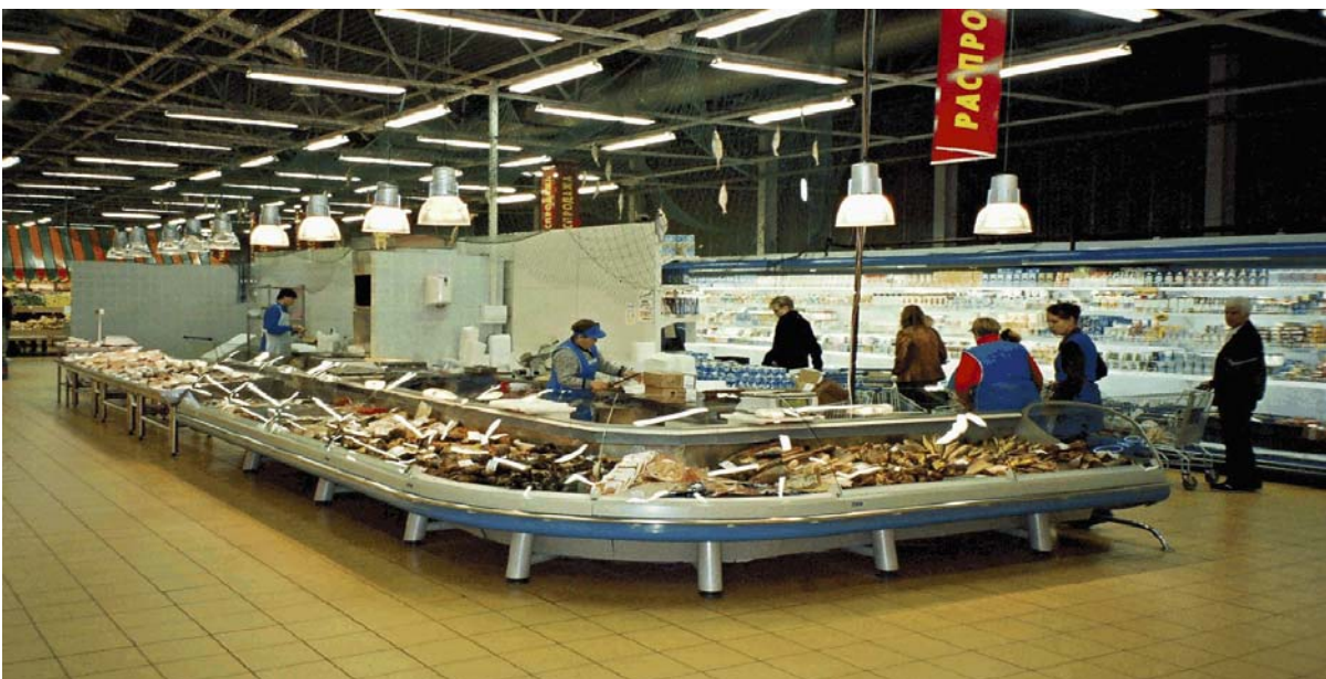
Okei supermarketin tuorekalatiski

Kaikki kalatuoteryhmät olivat hyvin esillä. Suurmyymälöiden kalatiskit olivat jopa kymmenien metrien mittaisia. Tuoreen ja pakastetun kalan valikoimat olivat suomalaisen mittapuun mukaan todella runsaat.