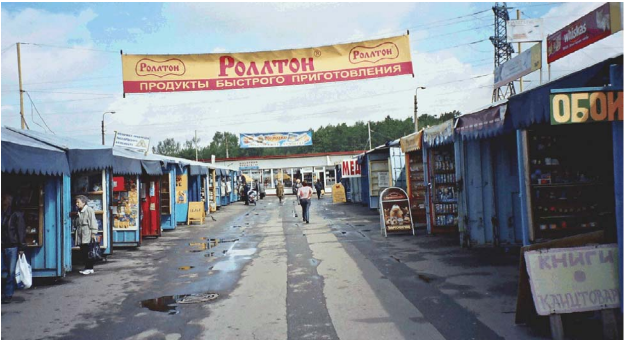
Udelnaja metroaseman läheisyydessä sijaitseva tori

Vähittäiskaupan kehittymisen myötä on syntynyt myös voimakkaasti kasvava yksityinen tukkuporras. Logistiikka kehittyi myös nopeasti. Nykyisin Venäjällä arvioidaan toimivan yli 2000 pelkästään kalan jakeluun ja kauppaan erikoistunutta tukkuliikettä. Osa näistä muistuttaa paljon suomalaisia kalatukkuliikkeitä. Kalatukkuliikkeitä harjoittavat usein myös pienimuotoista jalostusta. Maahantuontia harjoittavista yrityksistä suurin osa toimii Moskovassa. Pietari on toinen merkittävä maahantuontikeskus.