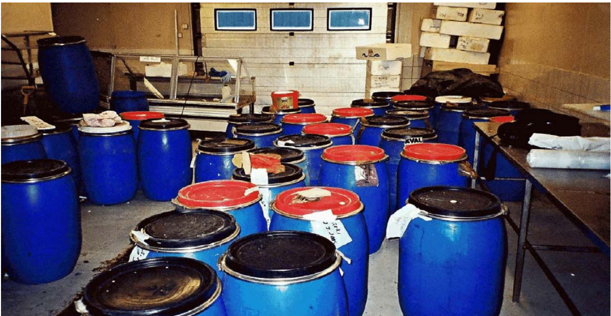
Suolattuja lahnoja sekä särkiä Kuusisen hallissa

Saamamme suolausresepti oli tarkoitettu vain lyhytaikaista säilytystä varten. Saalista tuli vähän eikä 50 tynnyrin erää saatu valmiiksi riittävän nopeasti. Helmikuussa 2005 todettiin, että tynnyreihin pakattu kala alkoi pilaantua. Syynä tähän oli liian pitkä varastointiaika käytettyyn suolausreseptiin nähden. Pilaantuneet kalat hävitettiin ja reseptiä muutettiin kevään kuluessa. Lopulta toukokuussa koe-erä oli valmis. Reseptiä oli muutettu niin, että säilyvyyttä piti olla yli kolme kuukautta aikaisemman parin viikon sijaan. Tynnyrit varastoitiin Kuusisen kylmähuoneeseen kesän ajaksi. Elokuun lopussa ne tarkastettiin ja todettiin hyvin säilyneiksi. Suolakalan koe-erät valmistettiin hyväksymättömissä tiloissa. Tämä osaltaan johti siihen, että koe-erän vientiä ei lopulta edes harkittu.