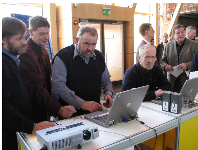
Skogsdagarnas deltagare besvarar den populära METSO-enkäten vid ministeriernas gemensamma infobås.

Den finansiering som staten redan har anvisat för naturskydd uppskattades till mindre än vad den de facto är. Majoriteten approximerade METSOs totalbudget (2003-2006) till bara 6 miljoner euro (rätt siffra 60 milj. euro). Flertalet antog också att totalbudgeten för de pågående naturskyddsprogrammen är endast 60 milj. euro då den i verkligheten är 600 milj. euro. Frågan om hur ett ytterligare skydd bör finansieras, om den svarande understöder det, besvarades oftast med statlig finansiering.