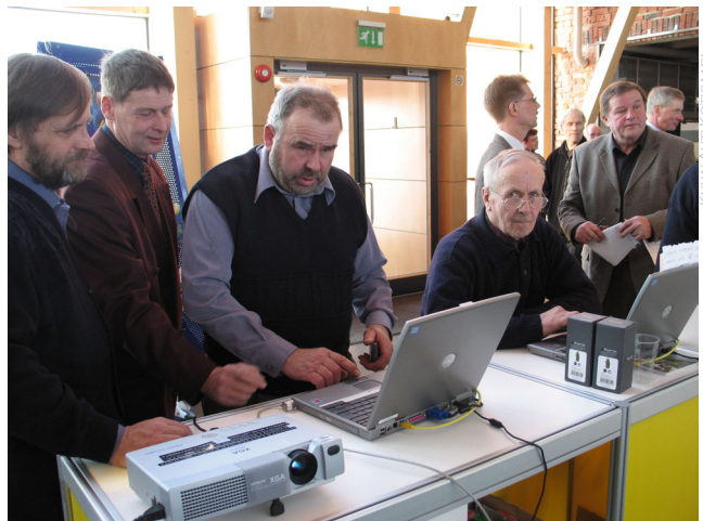
Metsänomistajatilaisuuden osanottajia ministeriöiden yhteisellä ständillä osallistumassa METSO-kyselyyn, josta tuli hyvin suosittu.

Luonnonsuojeluun valtion jo osoittamaa rahoitusta pidettiin pienempänä kuin se todellisuudessa on. Enemmistö aliarvioi METSON kokonaisbudjetin (2003-2006) arvellen sen olevan vain 6 milj. euroa (oikea luku 60 milj. euroa). Enemmistö arveli myös parhaillaan toteutuksessa olevien luonnonsuojeluohjelmien kokonaisbudjetin olevan vain 60 milj. euroa, kun se todellisuudessa on 600 miljoonaa euroa. Kysyttäessä miten lisäsuojelu tulisi rahoittaa, jos kysyjä sitä kannattaa, rahoituskeinoksi esitettiin useimmiten valtion rahoitusta.