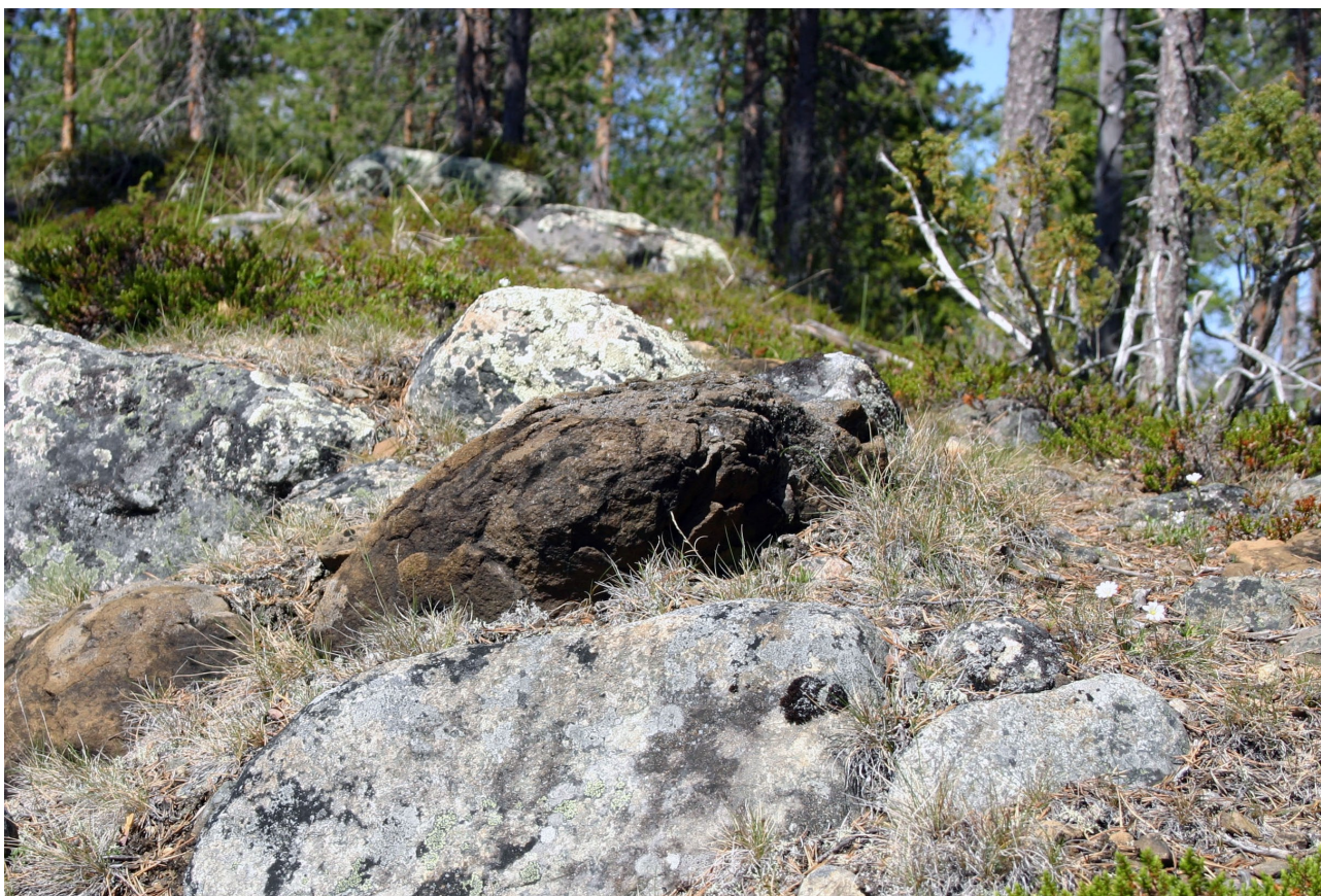
Ultraemäksiset luontotyypit ovat ravinne- ja kasvuoloiltaan ääreviä johtuen serpentiinikivilajista (musta kivi kuvan keskellä).