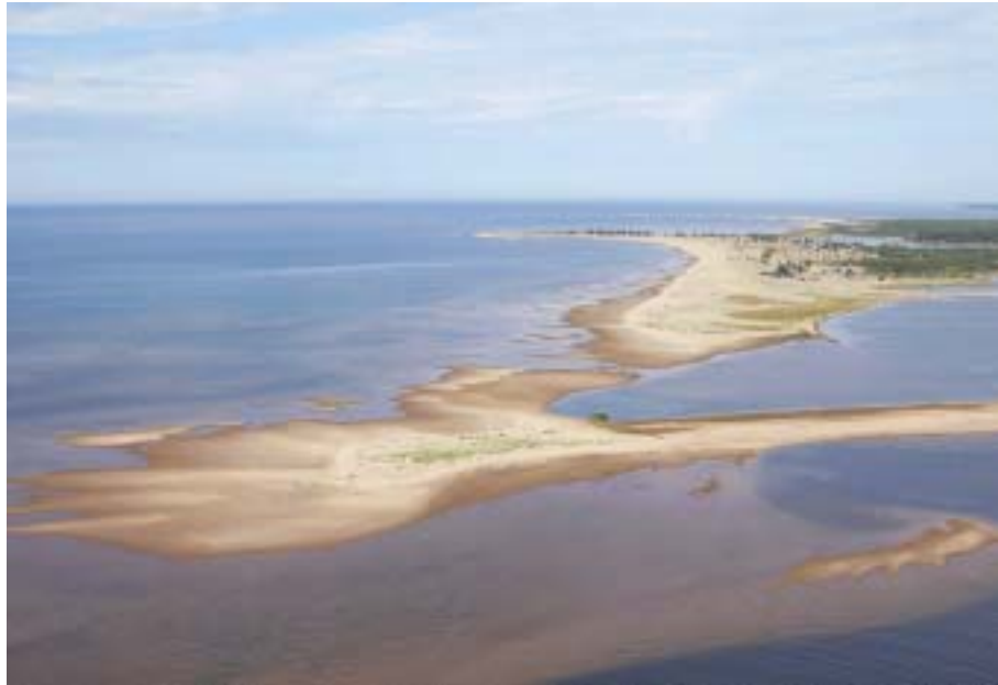
Rannikon Merestä metsäksi -verkostohankkeen alueen kauneutta. Kuvat vasemmalta oikealle: merenrantaniityillä esiintyvä hanhikäärmeenkieli, maankohoamis-

na on saada syntymään esimerkiksi jonkin teemakokonaisuuden puitteissa alueellisia pienten suojelukohteiden verkostoja, jotka ovat monimuotoisuudeltaan arvokkaita ja edistävät sosiaalista ja taloudellista kestävyyttä, kuten maaseutuyrittäjyyttä, työllisyyttä ja luontomatkailua.