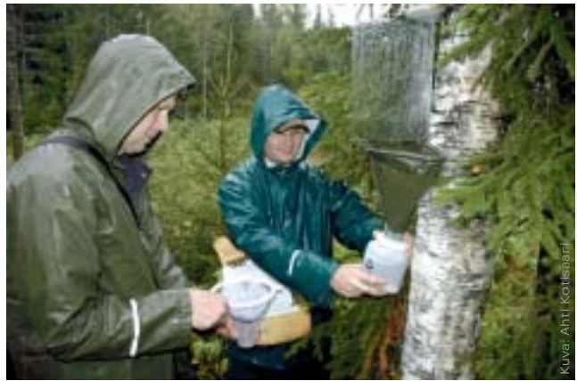
MOSSE-tutkimusohjelman tutkijat kokemassa hyönteispyydyksiä kesällä 2004.

Ensimmäisenä uudistetut metsien käsittelyohjeet julkisti Metsähallitus, joka julkaisi uuden ympäri- stöoppaan 7.7.2004. Oppaassa on huomioitu vii- meisin tutkimustieto ja vuosien myötä kertynyt käy- tännön kokemus. Henkilöstön koulutuskierroksen jälkeen oppaassa määritellyt käytännöt sisällyte- tään soveltuvasti kaikkiin uusiin leimikko- ja työ- maasuunnitelmiin. Leimikko- ja työmaasuunnitel-