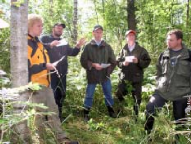
Kuva: Marja Kalliström