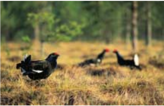
Esa Marjamäki/Skogsindustrin rf