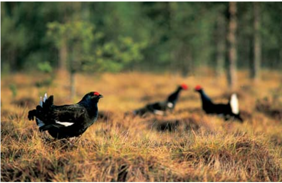
Esa Marjamäki/Skogsindustrin rf